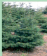
Nordmann-tannen (Abies Nordmanniana)